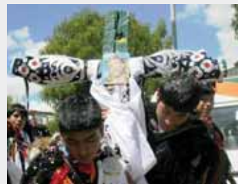
[ Fiesta de la Cruz ]