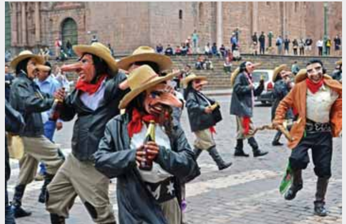
[ Fiesta del Dulce Nombre de Jesús ]