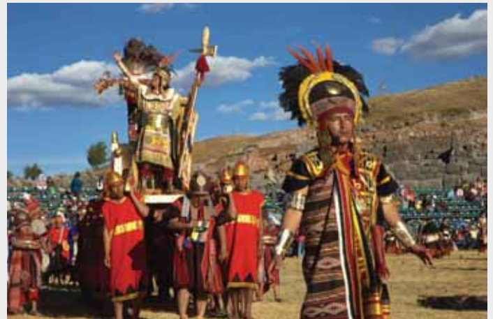
[ Fiesta del Inti Raymi ]